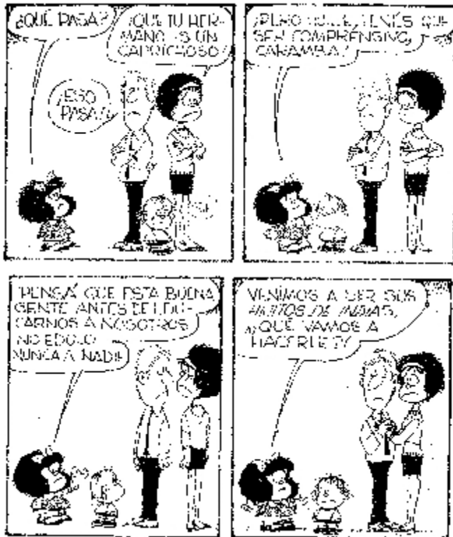
Mafalda es copyright de Quino.

Mafalda es peleadora, pensadora, soñadora. Vive preocupada por la situación del mundo y de su país. Su papá trabaja en una compañía de seguros en la era previa a la informática. La mamá es una típica ama de casa argentina de la década de los 60. Cocina, lava, plancha y compra. Fue a la universidad pero abandonó los estudios para casarse. Acompañan a Mafalda su variopinta pandilla, y su hermano Guille. Tiene una tortuga llamada Burocracia, que al igual que Mafalda odia la sopa. Los sentimientos se expresan al tiempo que se analizan (no en vano son argentinos). La familia transmite unos valores e ideales, entre los que priman la libertad, la solidaridad y el compromiso. Son una familia interesada por la cultura y lo que pasa en el mundo, con una clara implicación social y conciencia política. Se cuestionan constantemente, insistiendo en cierta idealización del saber.